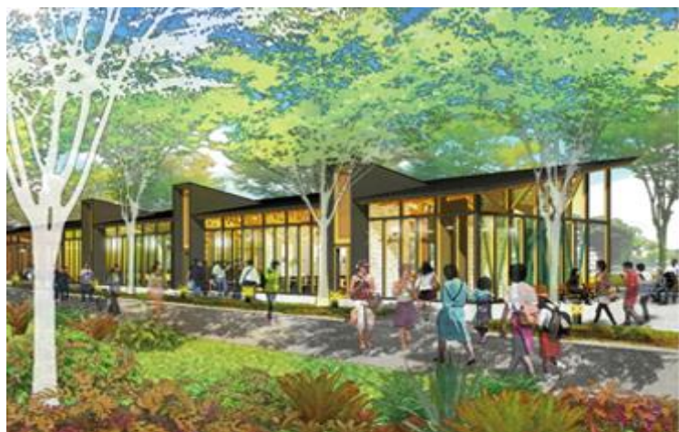
画像1 平面図・立面図・パース等