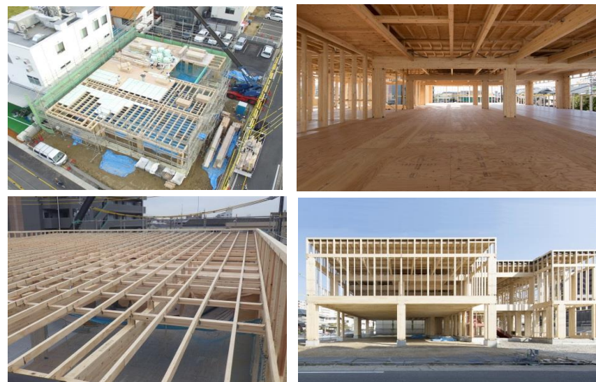
画像3 竣工時・引き渡し後等